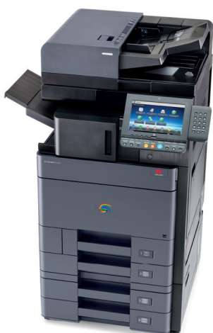
d-Color MF2553/MF3253 con finisher integrato DF-7100, alimentatore di originali a singola passata DP-7110, doppio cassetto PF-7100 e tastiera numerica