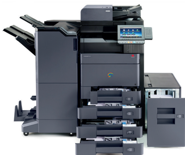
d-Color MF2553/MF3253 con finisher DF-7110, unità di piegatura BF-730, alimentatore di originali DP-7100, doppio cassetto PF-7100, tastiera numerica NK-7100, e cassetto laterale PF-7120