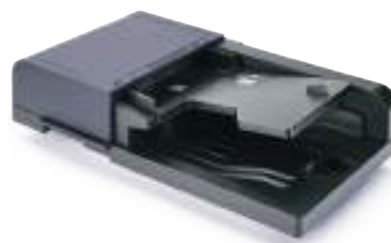
ALIMENTATORE DI ORIGINALI DP-5100 Alimentatore di originali da 75 fogli inverte automaticamente documenti stampati su due facciate.