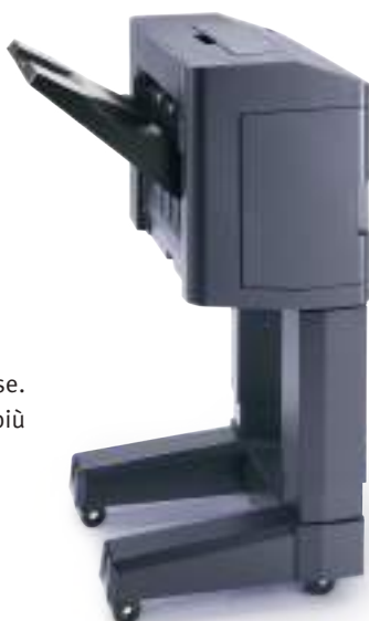
FINISHER 1.000 FOGLI DF-5110 Finisher 1.000 fogli per stampe voluminose. Pinzatura fino a 50 fogli in tre posizioni, più foratura opzionale.