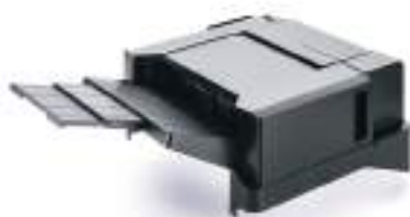
FINISHER 300 FOGLI DF-5100 Capacità in uscita fino a 300 fogli con pinzatura fino a 50 fogli in tre posizioni.